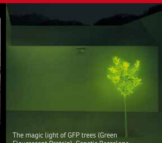
The magic light of GFP trees (Green Fluorescent Protein). Genetic Barcelona. Project: genetic creation of bioluminescent plants for urban and domestic use.