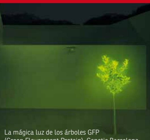
La mágica luz de los árboles GFP (Green Fluorescent Protein). Genetic Barcelona Project: creación genética de plantas bioluminiscentes para uso urbano y doméstico