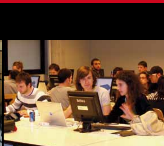
Vistas de los Talleres de Arquitectura Digital de la ESARQ (UIC), Barcelona