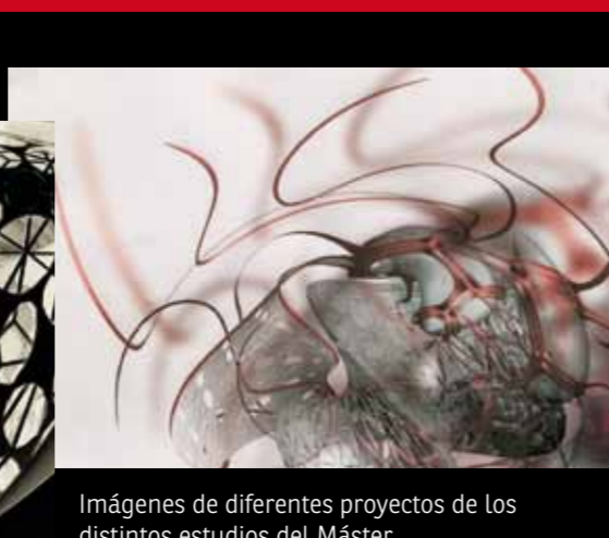
Imágenes de diferentes proyectos de los distintos estudios del Máster