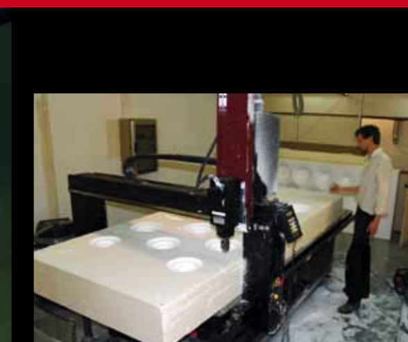
Views of ESARQ (UIC)'s Digital Architecture Workshops, Barcelona