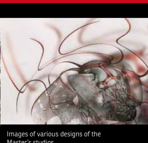
Images of various designs of the Master's studios